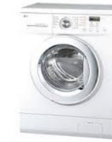
Machine combiné (lavage et essorage) 1950