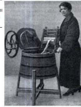
Machine à laver mécanique 1797

Grace à un système d'engrenage, la lavandière peut brasser le linge en tournant la manivelle.