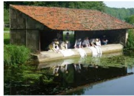
Lavandière rinçant la lessive au lavoir public.

Grace à un système d'engrenage, la lavandière peut brasser le linge en tournant la manivelle.