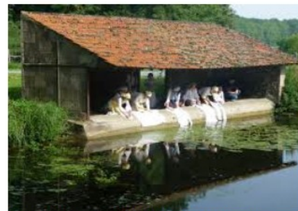
Lavandière rinçant la lessive au lavoir public.

Grace à un système d'engrenage, la lavandière peut brasser le linge en tournant la manivelle.