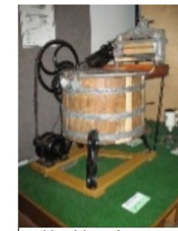
Machine à laver à moteur électrique 1915