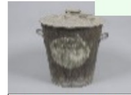
lessiveuse en acier galvanisé 1856