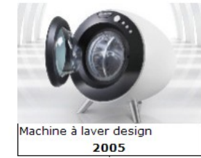
Machine à laver design 2005