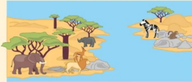
La France il y a quelques millions d'années