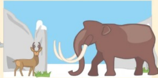
La France il y a environ 10 000 ans