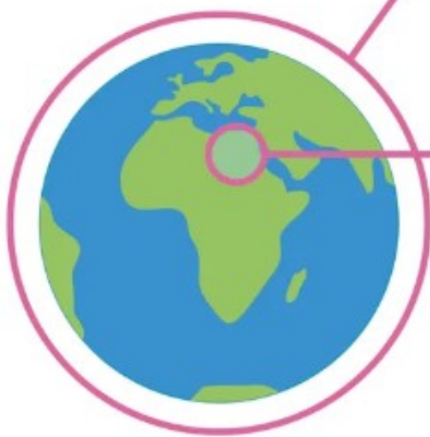
Terre : planète sphérique aplatie aux pôles