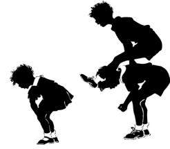
Jugar a pídola