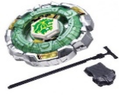
Jugar a la peonza