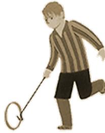
Jugar al aro