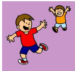
Jugar a tula