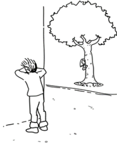
Jugar al escondite