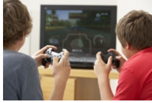
Jugar a la consola