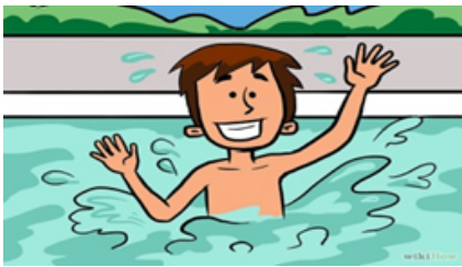
Ir a la piscina