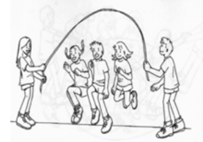
Saltar a la comba