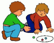
Jugar a las canicas