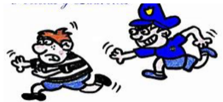
Jugar a policías y ladrones